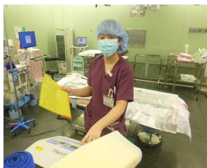
河北病院 看護師 令和3年度採用